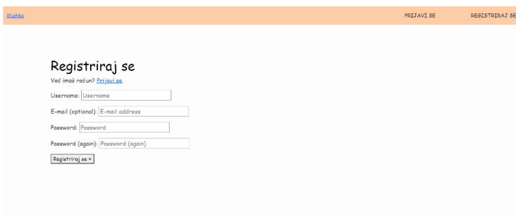
Slika 4: Registracija