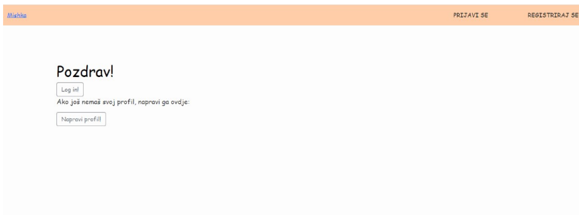
Slika 15: Početna stranica

Još jedna od funkcija koje korisnik ima je brisanje narudžbe iz baze. Slikom 16. je prikazano kako zapravo na stranici izgleda lista narudžbi.