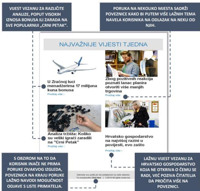
Slika 3 Primjer phishing poruke koja pokušava navući korisnika preko lažnih vijesti