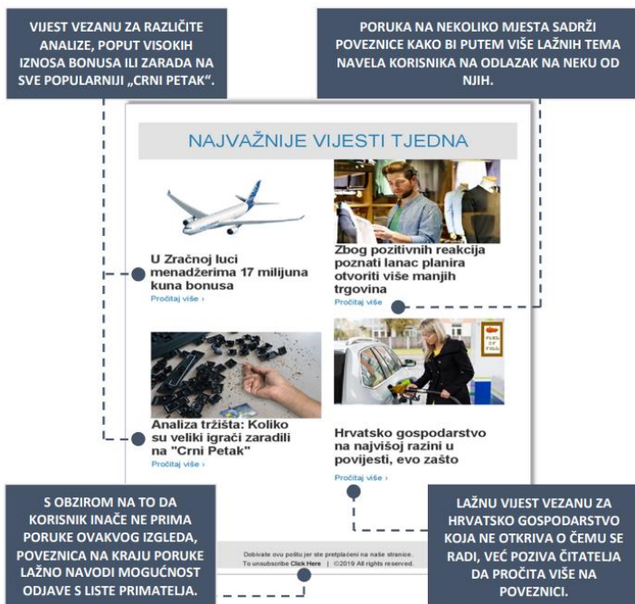
Slika 3 Primjer phishing poruke koja pokušava navući korisnika preko lažnih vijesti