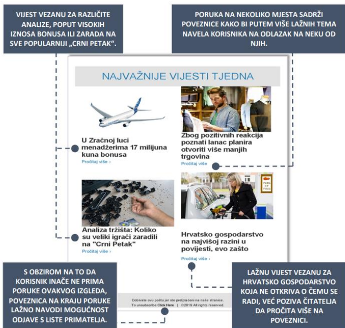
Slika 3 Primjer phishing poruke koja pokušava navući korisnika preko lažnih vijesti